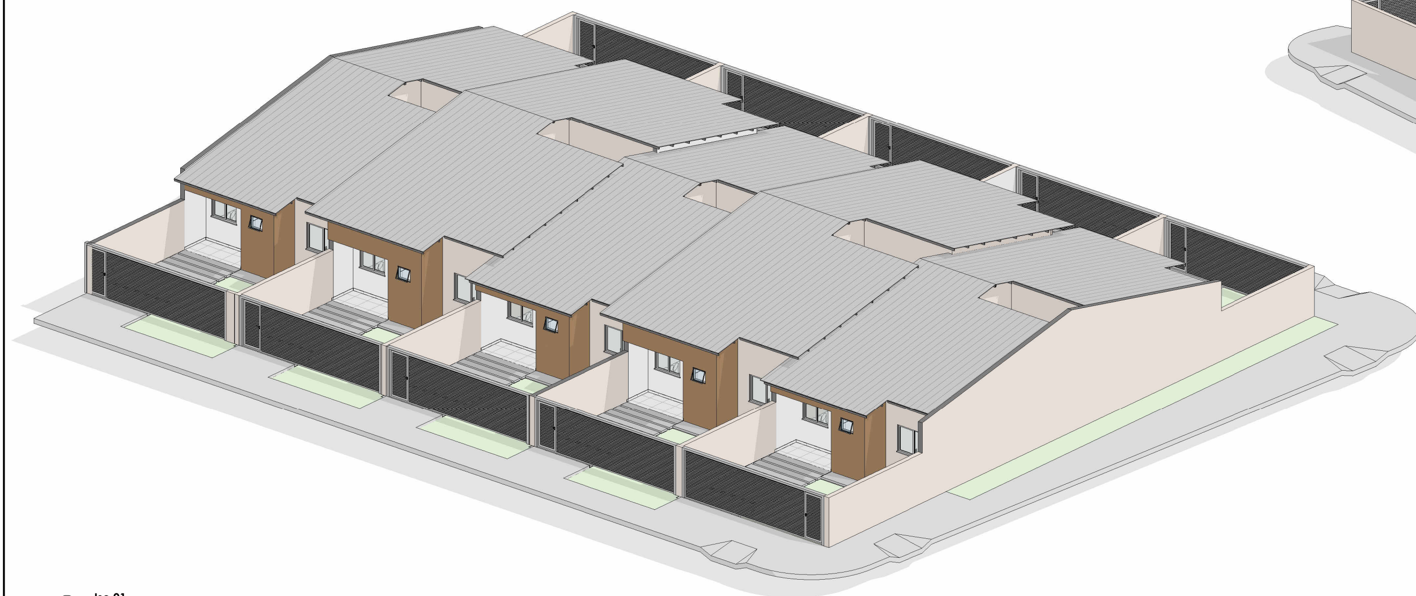
3 Iso 01